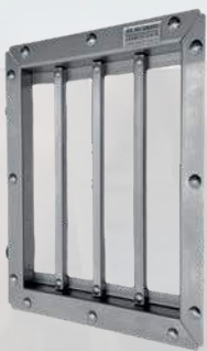
Abb. zeigt Modell Midi XL

MediumXL, (für z.B. 750 oder 1000 mm Buchtenhöhe): Kontaktfläche 660x330 mm Außenmaß mit Rahmen BxH: 740x547 mm