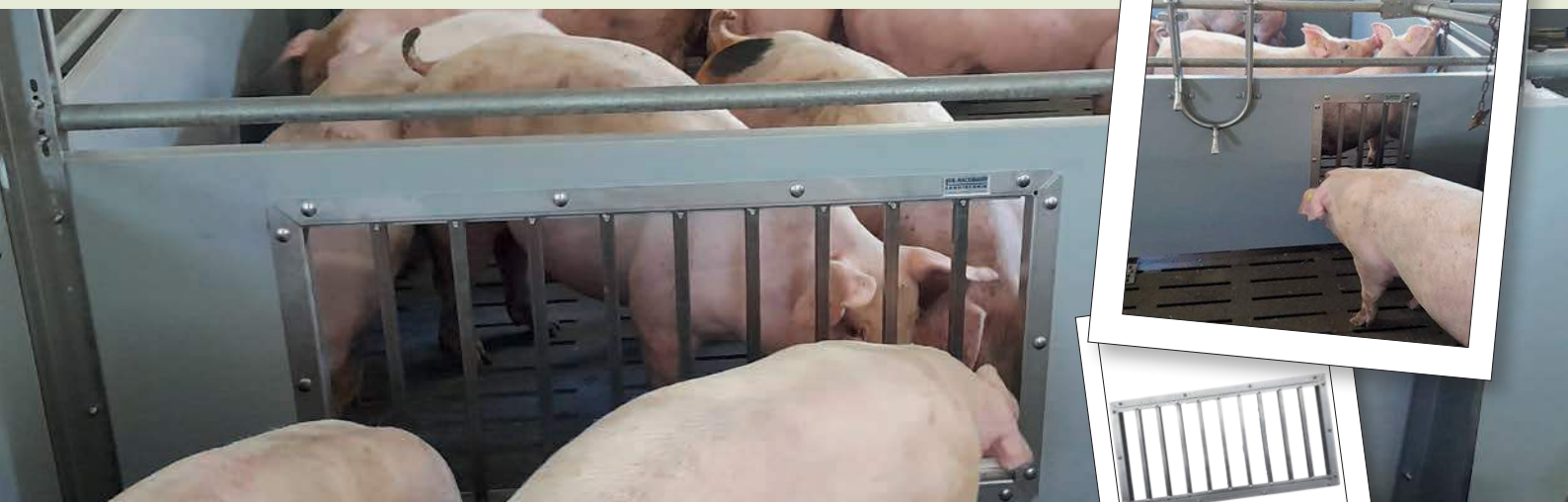
Abb. zeigt Gegenrahmen