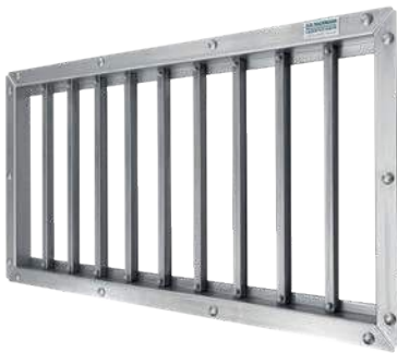
Abb. zeigt Modell Maxi XL