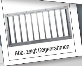
Abb. zeigt Gegenrahmen