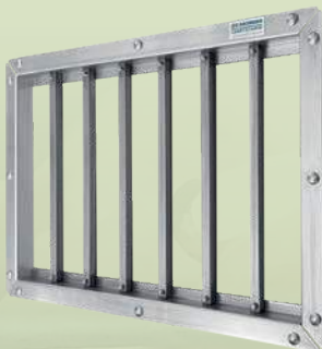
Abb. zeigt Modell Medium XL

Maxi XL, (für z.B. 750 oder 1000 mm Buchtenhöhe): Kontaktfläche 990x430 mm Außenmaß mit Rahmen BxH: 1070x547 mm