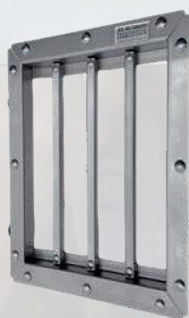
Abb. zeigt Modell Midi XL

MediumXL, (für z.B. 750 oder 1000 mm Buchtenhöhe): Kontaktfläche 660x330 mm Außenmaß mit Rahmen BxH: 740x547 mm