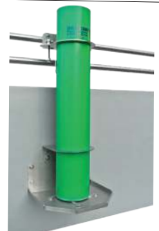
Funfeed Wühlfix 160 Wandmodell