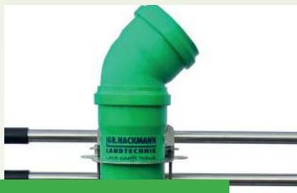
Seitenbefüllung 160/250mm (Option)