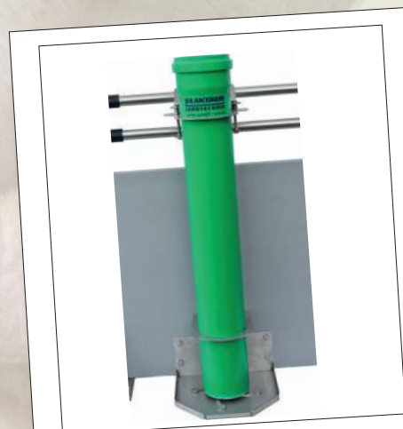
Funfeed Wühlfix Single 160

* freistehend 160 – 70 – 250 – 90 Modelle 160 mit Rohr KG2000 grün Modelle 250 mit Rohr KG orange