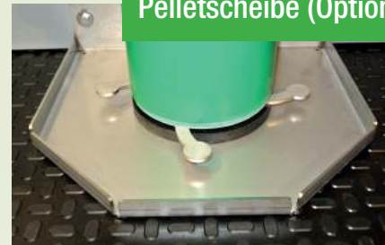
Treibpaddel mit Pelletscheibe (Option)