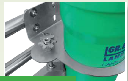
Werkzeuglose Ver- stellung Single