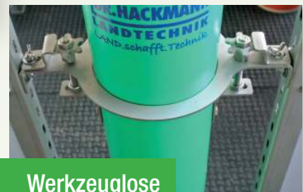
Werkzeuglose Verstellung Duo