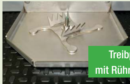
Treibpaddel mit Rührkamm

Passen Sie den Wühlfix individuell für Ihren Bedarf an