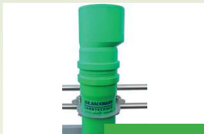
Trichter für 160er (Option)