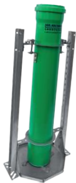
Funfeed Wühlfix Duo freistehend