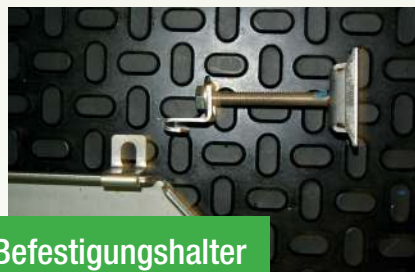
Befestigungshalter für Spalten