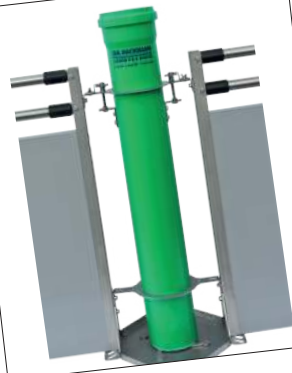
Wühlfix Duo in der Buchtenwand