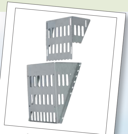
Funfeed 300 mit Option Flexblech