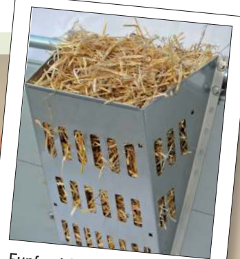
Funfeed 300 (ohne Flexblech) mit Langstroh