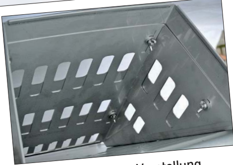
Werkzeuglose Verstellung des Flexbleches

Weitere Tierwohl-Produkte auf Anfrage. Ob Knabberrohre, Scheuerwände oder Tränketeknik, sprechen sie uns gerne an.