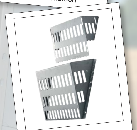
Funfeed 450 mit Option Flexblech