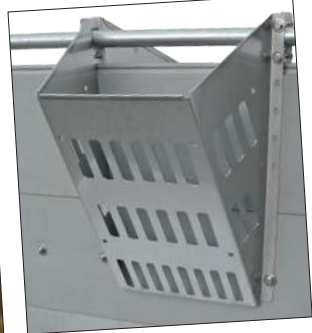
Funfeed 300 (ohne Flexblech) ohne Material

Unsere vielfach bewährte, „mitwachsende“ Funfeed-Raufutterraufe aus Edelstahl ist jetzt mit der Option eines einzigartigen Flexbleches erhältlich. Hiermit können die vorderen und sogar die seitlichen Schlitzöffnungen verstellt werden (optional auch nur für Vorderseite erhältlich). Dadurch ist die Funfeed auch für Kurzstroh, so wie Mais oder Grassilage geeignet. Dieses kann jederzeit bei einer vorhandenen Raufe 2.0 nachgerüstet oder sofort mitbestellt werden. Extrem robust durch Materialstärke 1,5mm (450er: 1,5 mm – Für Ferkel/Mast und 2,0 mm für Sauen). Zusätzlich werden die untere Seite und die drei oberen nach innen umgeschlagen (gekantet). Dadurch besteht keine Verletzungsgefahr und die Raufe ist extrem stabil. Der Behälter braucht unten nicht verschraubt werden und hat einen Reinigungsspalt von ca. 10mm. Viele Vorteile gegenüber den meisten handelsüblichen Raufen. Für Kleingruppen Funfeed 300 auch ohne Seitenbohrung erhältlich (optional auch nur für Vorderseite erhältlich), fragen sie uns danach!