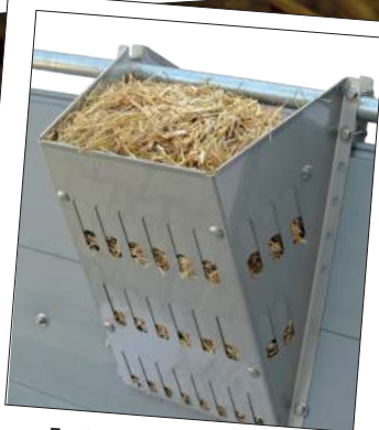
Funfeed 300 (mit Flexblech) mit Kurzstroh