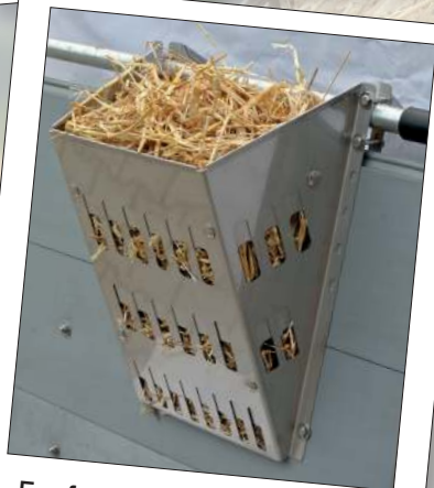
Funfeed 300 (mit Flexblech) mit Langstroh