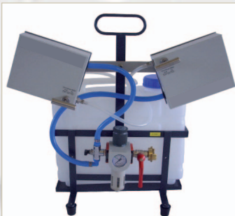
S 1 Profi Doppelkopf Reichweite bis zu 90 m (auch als Automatikversion)