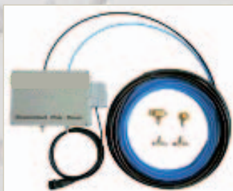
Festinstallationsanlagen: (Nach Kundenwunsch)