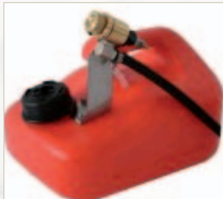
S 2 Mini Reichweite bis zu 15 m