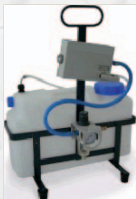
S 1 Profi Reichweite: bis zu 45 m (auch als Automatikversion)