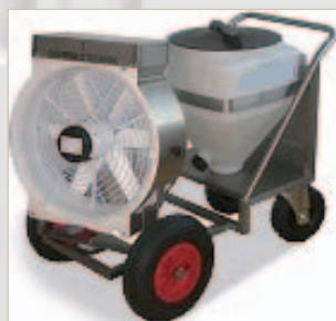
TW1 Power: Reichweite bis zu 100 m